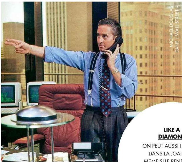
MICHAEL DOUGLAS DANS « WALL STREET »